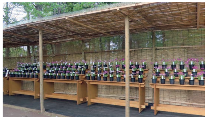
②会期中は、100種類以上の園芸品種をご覧いただけます