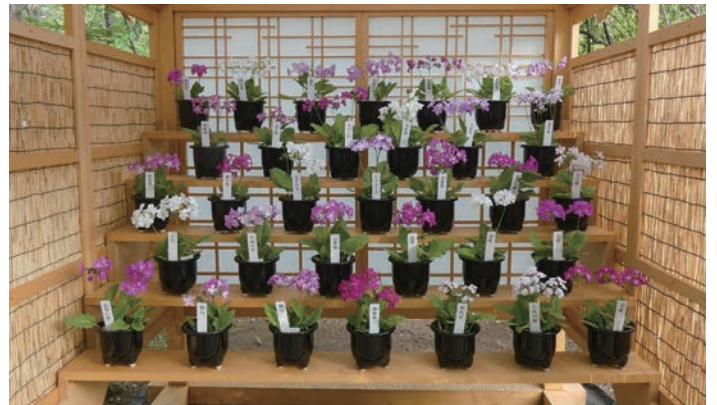
①桜草花壇:江戸時代に考案された観賞方法

1種の野生種から作出されたとは思えないほどの多彩な色、形、姿をお楽しみください。