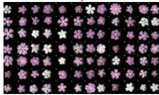
園芸品種の交配から生じる多様な色・形