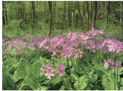
サクラソウの自生地の様子

さくらそうとはどのような植物か？野生のサクラソウから、さくらそう栽培の歴史、園芸品種の由来と成立までを、パネルで解説します。